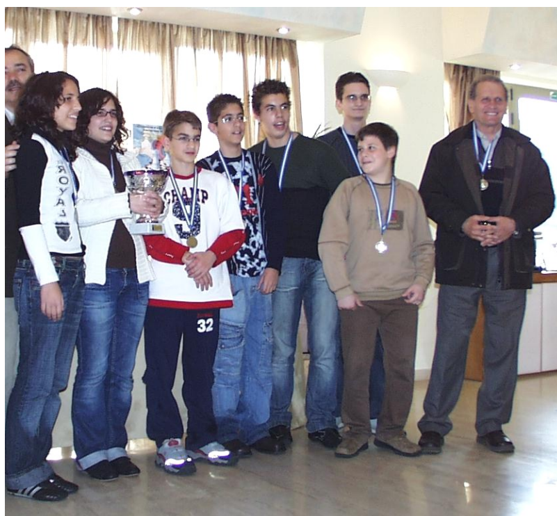
Η ομάδα μας κατά την βράβευση για την επιτυχία της στο Πανελλήνιο Πρωτάθλημα Νέων.

Διαβάστε για την επιτυχία των νεαρών σκακιστών μας που κατέκτησαν την τρίτη θέση στο Πανελλήνιο Πρωτάθλημα Νέων που πραγματοποιήθηκε στα Χανιά και για τις υπόλοιπες σκακιστικές διοργανώσεις της περιόδου, ενημερωθείτε για τις εκδρομές που έγιναν και που έχουν προγραμματιστεί για το προσεχές διάστημα και ακονίστε τη σκέψη σας με το «χριστουγεννιάτικο» πρόβλημα της τελευταίας σελίδας.