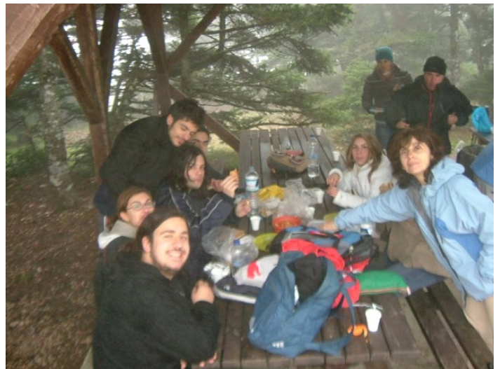
Οι ορειβάτες γευματίζουν στον καταφύγιο Φλαμπούρι.