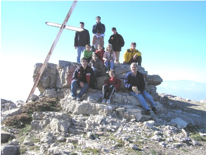
Οι ορειβάτες στην κορφή του Κλωκού

Στις 12 Νοεμβρίου πραγματοποιήθηκε τουριστική-πεζοπορική εκδρομή στην Φτέρη Αιγίου με ανάβαση στον Κλωκό Αχαΐας. Συμμετείχαν σαράντα εννιά άτομα και δώδεκα από αυτά, μετά από πορεία δύο ωρών, ανέβηκαν στην κορφή.