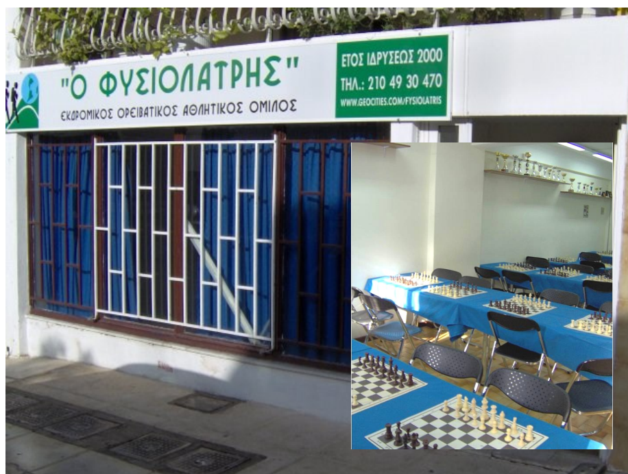
Το νέο εντευκτήριο μας και στην ένθετη φωτογραφία άποψη της αίθουσας.

Στο Ενημερωτικό Δελτίο μπορείτε μεταξὺ άλλων να πληροφορηθείτε για τις δραστηριότητες του σκακιστικού τμήματος, για τις εκδρομές και τις εκδηλώσεις που προγραμματίζουμε. Καλή ανάγνωση!