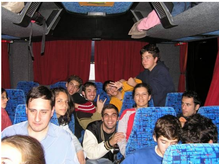
Η μάχη της γαλαρίας στην επιστροφή