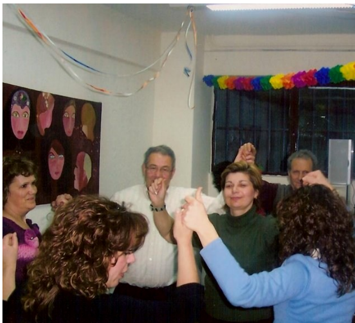
Κι ο χορός καλά κρατεί...