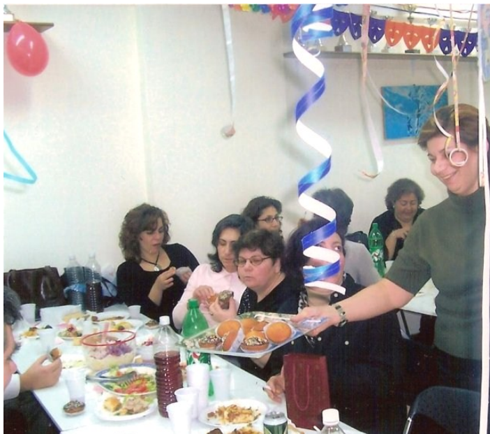
Η ποικιλία των εδεσμάτων ήταν μεγάλη

Φαγητό, τραγούδι και χορός ήταν τα συστατικά της όμορφης βραδιάς που πραγματοποιήθηκε την Τσικνοπέμπτη 23 Φεβρουαρίου στα γραφεία του Ομίλου μας. Τα μέλη και οι φίλοι που γέμισαν την αίθουσα γεύτηκαν σπιτι-