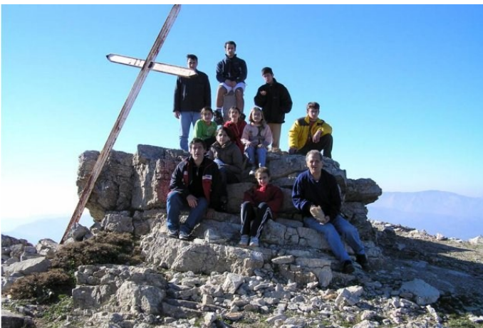
Κλωκός: Αυτοί που έφθασαν στην κορυφή