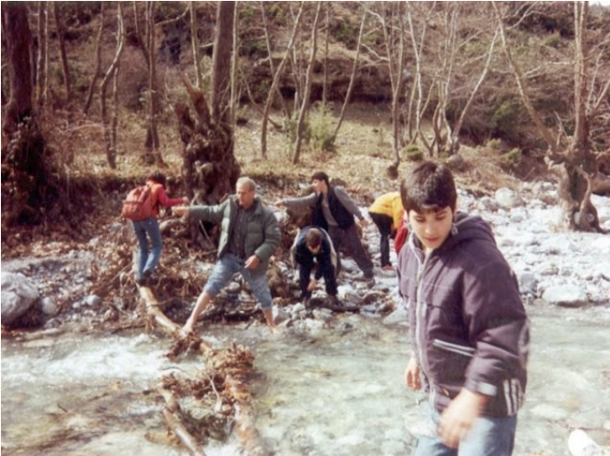
Από την πεζοπορία στον Ενιπέα