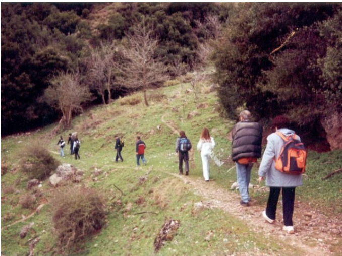
Από την πεζοπορία στο Βουραϊκό