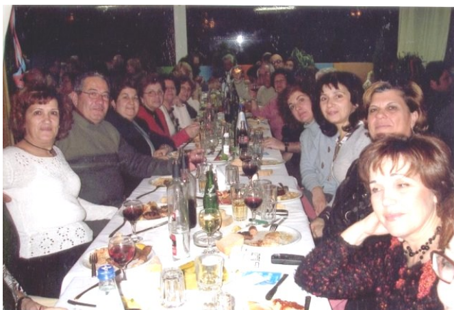
Κατερίνη. Καλή παρέα άφθονο κρασί και ποντιακό κέφι

Την άλλη μέρα (Κυριακή) ξεκινήσαμε για το Βέρμιο στη Παναγία Σουμελά όπου προς μεγάλη έκπληξη και χαρά μικρών και μεγάλων φίλων μας, βρήκαμε χιόνι, φαινόμενο σπάνιο για τη φετινή χρονιά. Αφού επισκεφτήκαμε τη μονή, παίξαμε στο χιόνι και βγάλαμε τις καθιερωμένες φωτογραφίες ξεκινήσαμε για τη Κοζάνη για να παρακολουθήσαμε το τοπικό καρναβάλι. Πολλά σατυρικά άρματα, ενδυμασίες με πολύ χρώμα που σατίριζαν γεγονότα της επικαιρότητας γραμμένα στην τοπική διάλεκτο σκορπώντας γύρω κέφι και γέλιο. Δεν χάσαμε την ευκαιρία να επισκεφτούμε το λαογραφικό μουσείο, στο κέντρο της πόλης σε παραδοσιακό κτίριο και μείναμε κατάπληκτοι από το πόσο πλούσιο υλικό είχε. Αν κάποτε βρεθείτε εκεί μη παραλείψετε να το συμπεριλάβετε στις επισκέψεις σας. Το κρύο τσουχτερό αλλά ζεσταθήκαμε αρκετά αργά το απόγευμα παρακολουθώντας το τοπικό έθιμο (το άναμμα των φανών) και χορεύοντας μέχρι αργά το βράδυ.