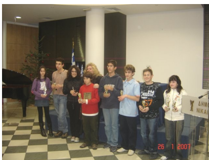
Βράβευση των σκακιστών

Ακολούθησαν οι βραβεύσεις των αθλητών του σκακιστικού τμήματος που διακρίθηκαν τη χρονιά που πέρασε. Βραβεύτηκαν οι νεαροί αθλητές που οδήγησαν την ομάδα μας στην πρόσφατη επιτυχία της κατάκτησης της 3ης θέσης στο Πανελλήνιο Πρωτάθλημα Νέων στο Ρίο.