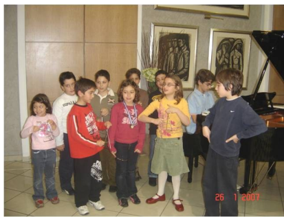
Εκδήλωση στο Δημαρχείο