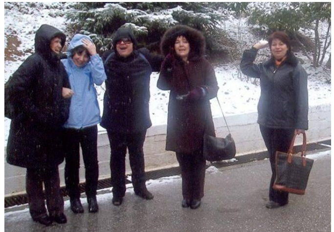
Βέρμιο. Λίγο χιόνι και πολύ κρύο

Ξεκινήσαμε το πρωί του Σαββάτου με πολύ κέφι για ένα πολλά υποσχόμενο τριήμερο. Το πρόγραμμα πλούσιο, η παρέα απίθανη και δοκιμασμένη (50 άτομα, μικροί μεγάλοι μια οικογένεια), ποιος νοιαζόταν για τον καιρό που μας κοιτούσε απειλητικά. Πρώτη στάση στον Αλμυρό στο θαυμάσιο δάσος από βελανιδιές Κουρί, όπου οι περισσότεροι δεν αντισταθήκαμε να περπατήσουμε τα μονοπάτια και τα γεφυράκια του, να χαζέψουμε τα παγώνια αλλά και ζαρκάδια που προς μεγάλη μας έκπληξη έτρεχαν μπροστά μας. Αφού ξεκουραστήκαμε στο παραδοσιακό τοπικό εστιατόριο – καφενείο συνεχίσαμε το ταξίδι μας για το Κορινό Πιερίας όπου μας περίμενε το ξενοδοχείο μας για ξεκούραση. Το βραδάκι ήμασταν έτοιμοι για την Κατερίνη. Αποκριάτικο γλέντι με ζωντανή μουσική και το γνωστό κέφι της παρέας μας μέχρι το