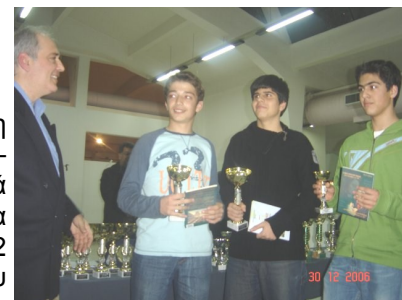
Βράβευση αθλητών στα νεανικά Αττικής