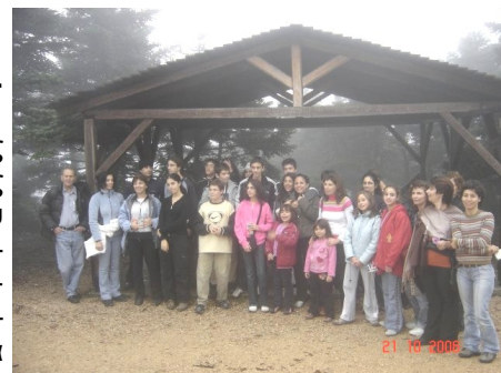
Ημερήσια εκδρομή στην Πάρνηθα.

Το τριήμερο της Καθαρής Δευτέρας 17-19 Φεβρουαρίου ο Φυσιολάτρης οργάνωσε μια εκδρομή στην Κοζάνη-Παναγία Σουμελά όπου τα είχε όλα. Καρναβάλι-Μουσεία –Βραδινή διασκέδαση - παραδοσιακή φασολάδα και χιονοπόλεμο. Τι Λωζάνη ..Τι Κοζάνη!!