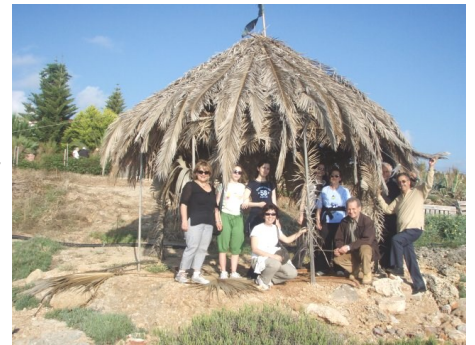
Η πεζοπορική ομάδα προς το Λαγουβάρδο

Επιστρέψαμε νωρίς το απόγευμα στη Νίκαια με τις μπαταρίες μας γεμάτες, έτοιμοι για νέες εξορμήσεις.