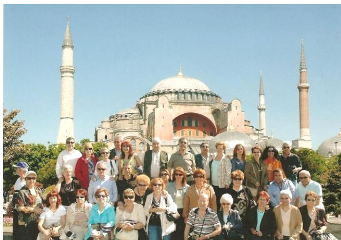
Κωνσταντινούπολη. Ο Φυσιολάτρης στην Αγία Σοφία

Ανέκαθεν ήθελα να πάω στη Πόλη, να μείνω στο Πέραν, να περπατήσω στο Ταξίμ, να πάρω αγίασμα, σαν τη Λωξάντρα, από την Παναγία τη Μπαλλουκλιώτισσα. Είχα όμως ενδοιασμούς κάθε φορά. Δεν ήθελα να ακούσω τους Τούρκους ξεναγούς να οικειοποιούνται την Ελληνική Ιστορία, όπως το συνηθίζουν δυστυχώς, οι «φιλοι» και γείτονές μας και πάντα στενοχωριόμουν όταν έβλεπα την Αγία Σοφία με τους μιναρέδες γύρω