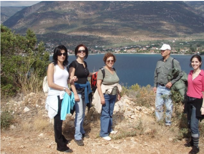
Η πεζοπορική ομάδα στα Τριζόνια.