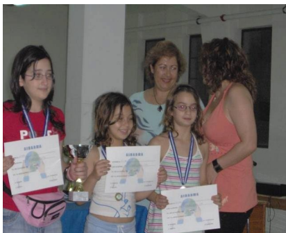
Το μέλλον του Φυσιολάτρη