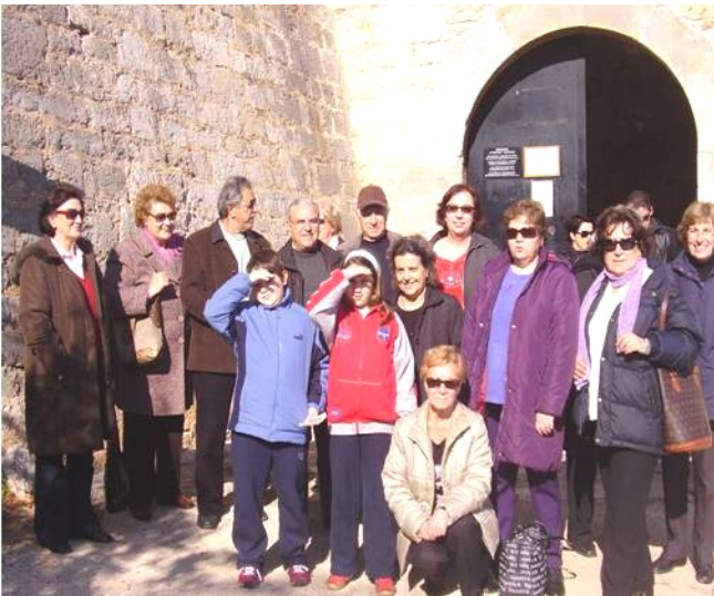
Ναύπλιο. Επίσκεψη στο Παλαμίδι .

Μονοήμερη εκδρομή του Φυσιολάτρη στη πρώτη Πρωτεύουσα του Ελεύθερου Ελληνικού Κράτους στο Ναύπλιο.