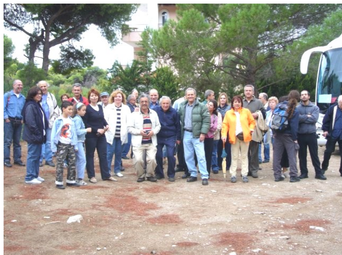
Απόδραση του Φυσιολάτρη από την Αθήνα.