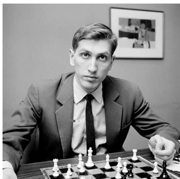
Παγκόσμιος Πρωταθλητής το 1972 και πρωταθλητής ΗΠΑ σε ηλικία 14 ! ετών.

Κάθε παγκόσμιος πρωταθλητής αποτελεί εξ ορισμού ένα αξιοπρόσεκτο φαινόμενο. Με συστηματική πολυετή προσπάθεια, ένας άνθρωπος ξεχωρίζει από τους συνανθρώπους του και κατακτά μια κορυφή πριν και πάνω από όλους τους άλλους. Η βασιλεία του νομοτελειακά έχει ημερομηνία λήξης, καθώς η ιστορία και η ανθρώπινη κοινωνία προχωράει για να ορίσει τον διάδοχό του..