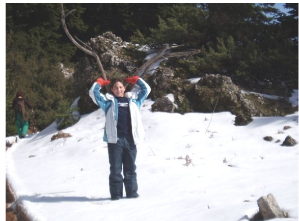
Οίτη. Παύλιανη .

Η εκδρομή στην Οίτη ήταν καταπληκτική . Οι πεζοπόροι περπάτησαν αρκετές ώρες μέσα στα καταπράσινα έλατα και απόλαυσαν τα ωραία τοπία. Ανεβαίνοντας ψηλά συνάντησαν αρκετό χιόνι και έφτασαν μέχρι ένα σημείο, όπου το παγωμένο χιόνι δεν τους επέτρεψε να συνεχίσουν, μιας και δεν είχαν μαζί τους τον κατάλληλο εξοπλισμό για ανάβαση σε πάγο.