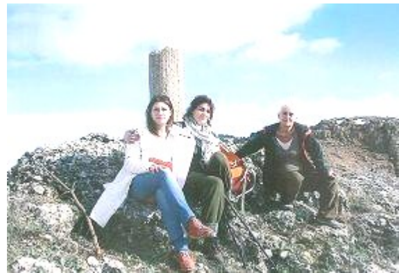
Μαυρονόρος. Οι τρεις γυναίκες που έφτασαν στην κορυφή

Η ανάβαση στην Ευρωστία πραγματοποιήθηκε από μια ομάδα ορειβατών και τελικά μόνο πέντε κατάφεραν να σκαρφαλώσουν μέχρι την κορυφή μετά από προσπάθεια και κόπο και να ατενίσουν στο βάθος τον Χελμό.