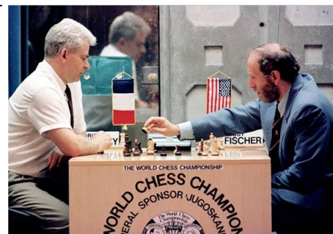
Βελιγραδι 1992 εναντίον του Σπάσκυ

δημόσιο βίο, περιπλανώμενος ανά την υφήλιο και καταζητούμενος από την πατρίδα του γιατί έσπασε το εμπάργκο κατά τον βρόμικο πόλεμο των ΗΠΑ κατά της Γιουγκοσλαβίας όταν το 1992 δέχθηκε να πάρει μέρος σε αγώνα κατά του Boris Spassky στο αποκλεισμένο Βελιγράδι..