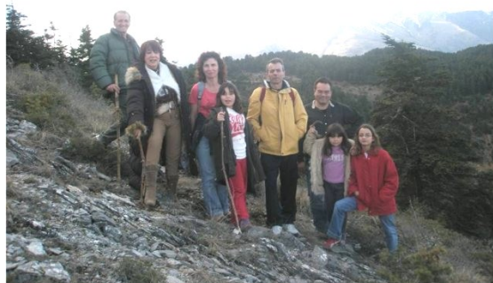
Κατάβαση στον Κάτω Όλυμπο.