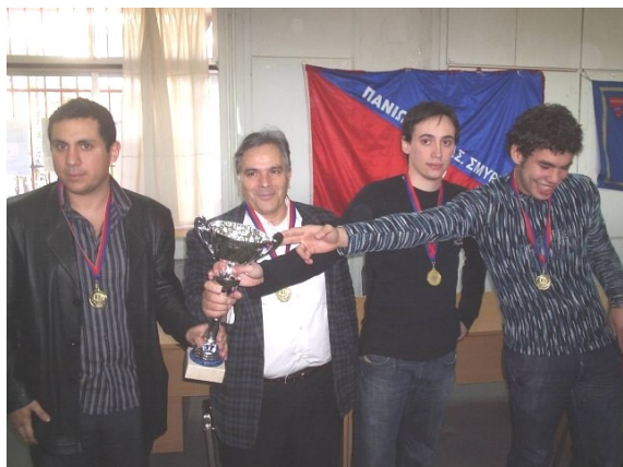
Ο Φυσιολάτρης Κυπελλούχος Αττικής 2008.