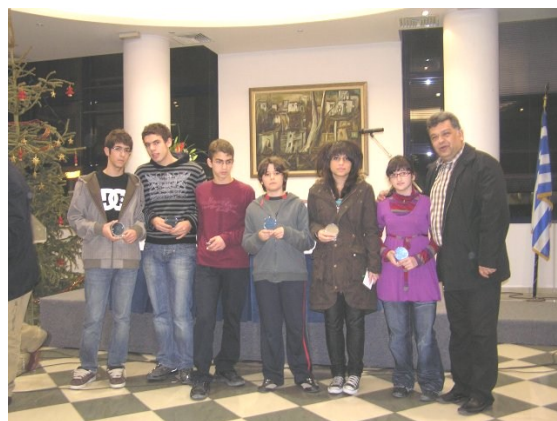
Βράβευση σκακιστών από τον Δήμαρχο κ.Μπενετάτο.

Το κόψιμο της Πρωτοχρονιάτικης πίτας μας πραγματοποιήθηκε στο Δημαρχείο την Παρασκευή 18 Ιανουαρίου 2008 .