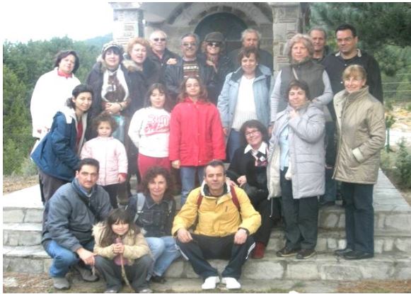
Καλλιπεύκη , Κάτω Όλυμπος. .

(Μία πολύ όμορφη εκδρομή με αφορμή το τριήμερο της Καθαρής Δευτέρας πραγματοποιήσαμε στη Βόρεια Ελλάδα. Φύγαμε το Σάββατο 8/3 το πρωί και με μια μόνο στάση για καφέ στα Καμμένα Βούρλα , φθάσαμε αργά το μεσημέρι στην Καλλιπεύκη. Ένα πανέμορφο χωριό στους πρόποδες του νότιου Ολύμπου κατάφυτο από Πεύκα (εξ ου και το όνομα ) και έλατα. Οι πεζοπόροι ανέβηκαν στο Προφήτη Ηλία μέσα από ένα δρόμο γεμάτο έλατα που ακουγόντουσαν μόνο κελαηδίσματα των πουλιών και μακρινά γαυγίσματα σκύλων. Τη γαλήνη του δάσους έσπασαν οι κτύποι της