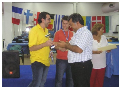
15ο Διεθνές οπεν 2007