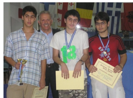
15ο Διεθνές οπεν 2007