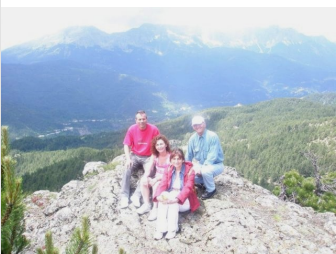
Στη κορυφή στο Φλαμπούρι .

Τη δεύτερη μέρα βρεθήκαμε στα όμορφα Ζαγοροχώρια. Τι να πρωτοθαυμάσεις τα όμορφα τοπία μέσα στα καταπράσινα πεύκα και έλατα, τα ποτάμια Αώο, Βοϊδομάτη και Βίκο με τα ωραιότερα πέτρινα γεφύρια