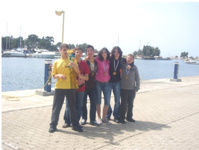
Οι μαθητές με το κύπελλο στη Παραλία της Χαλκιδικής :

Το Πανελλήνιο σχολικό πρωτάθλημα 2008 έγινε στο Πόρτο Καρράς στη Χαλκιδική το Σάββατο 19 Απριλίου 2008.