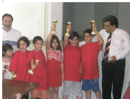
Οι νικητές από κάθε τάξη.

Μεγάλη επιτυχία είχε το μαθητικό τουρνουά που διοργανώθηκε από τον Α.Ο.Δ.Ν. στις 6 Ιουνίου στην Ένωση Ποντίων Νικαίας. Συμμετείχαν αρκετοί μαθητές/τριες από όλα τα Δημοτικά Σχολεία του Δήμου μας. Δόθηκαν κύπελλα στους τρεις πρώτους νικητές κατά τάξη και αναμνηστικά μπλουζάκια σε όλους .