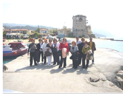
Ουρανούπολη –Άγιο Όρος.

Πραγματοποιήθηκε το Σάββατο—Κυριακή—Μ.Δευτέρα η εκδρομή στο Πόρτο Καρράς. Με ενδιάμεσο σταθμό την Θεσσαλονίκη (Λευκός Πύργος) φτάσαμε στη Χαλκιδική. Επισκεφτήκαμε την Ουρανούπολη αλλά χάσαμε το караβάκι για τον διάπλου του Αγίου