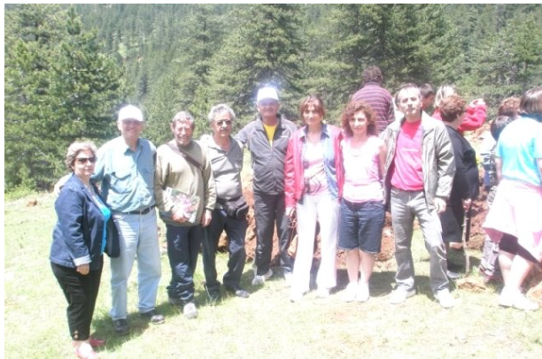
Θεμελίωση του Οικολογικού καταφυγίου στη Λάιστα με το Διεθνούς φήμης Γάλλο αλπινιστή Φρανσουά Λαμπάντ (τρίτος από τα αριστερά)

Ένας από τους πιο σημαντικούς υδροβιότοπους της Ελλάδας όπου προσελκύει χιλιάδες πουλιά όπως