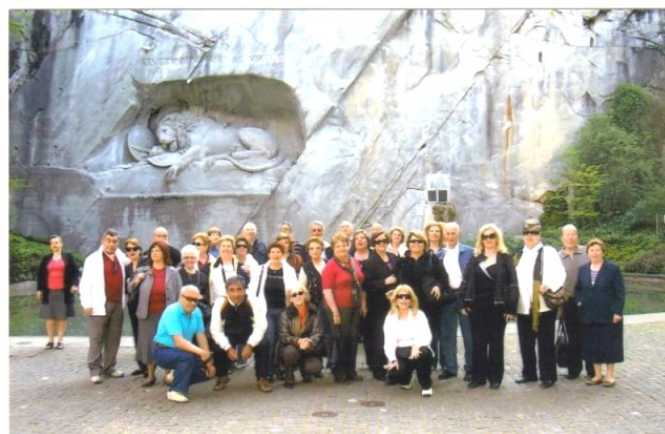
Οι εκδρομείς στο λιοντάρι της Λουκέρνης.

Οι εκδρομείς επισκέφθηκαν το Ινσμπουργκ και το Σάλτσμπουργκ (πατριδα του Μότσαρτ) ,το Μόναχο (πρωτεύουσα της Βαυαρίας) και τους καταρράκτες του Ρήνου, τη Ζυρίχη (πόλη των τραπεζών και των ρολογιών), τη Λουκέρνη , Γενεύη (έδρα του Ο.Η.Ε. ) Λωζάνη, Ιντερλάγκεν και Βέρνη ( Πρωτεύουσα της Ελβετίας) ,και το Λουγκάνο, Κόμο και Μιλάνο στην Ιταλία.