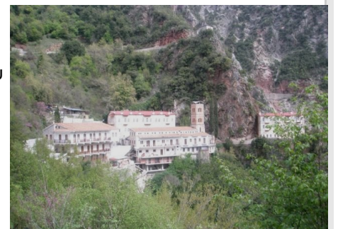
Η ιστορική Μονή του Προυσσού .

Αργά το απόγευμα ξεκίνησε η επιστροφή μας για Νίκαια με ενδιάμεση στάση.