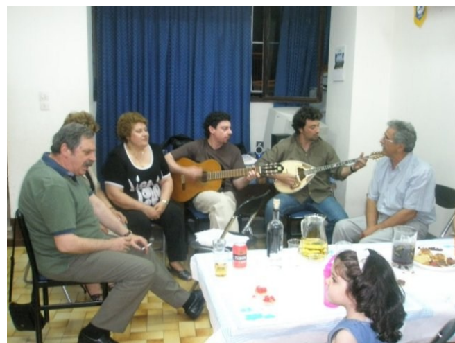
Ζωντανή μουσική και τραγούδι.

Το Σάββατο 31 Μαΐου το εκδρομικό τμήμα του συλλόγου διοργάνωσε μια βραδιά με ζωντανή μουσική , φαγητό και ποτό. Οι κυρίες του συλλόγου επέδειξαν τις ικανότητες τους στη μαγειρική και στη ζαχαροπλαστική. Έπειτα όλοι μαζί τραγούδησαν και χόρεψαν με το κρασί και το τσίπουρο να ρέει άφθονο.