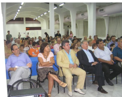
15ο Διεθνές οπεν 2007.