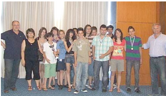
Καβάλα ,Πρωταθλήτρια Ελλάδας στο σκάκι το 2008 .

❖ Πρωταθλήτρια ομάδα το 2008 στο σκάκι αναδείχθηκε η πανίσχυρη ομάδα της Καβάλας με δεύτερη την Ε. Σ. Θεσσαλονίκης και τρίτο τον Κύδωνα Χανίων.