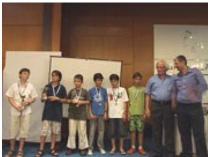
Οι νικητές στα Α 12