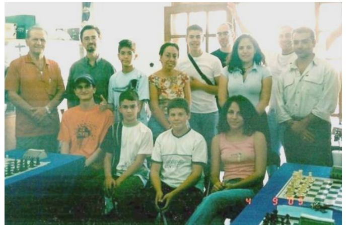
Η ομάδα του Φυσιολάτρη πριν 3 χρόνια στην άνοδο της στη Β΄ Εθνική.

Η άνοδος στην Α΄ Εθνική όταν η ομάδα ξεκίνησε από την Β΄ τοπική κατηγορία το 2002, έμοιαζε μακρινός και απλησίαστος στόχος, κάποιοι όμως, παρά τις αντιξοότητες που παρουσιάστηκαν ενδιάμεσα, πίστεψαν και δούλεψαν για την επίτευξή του.