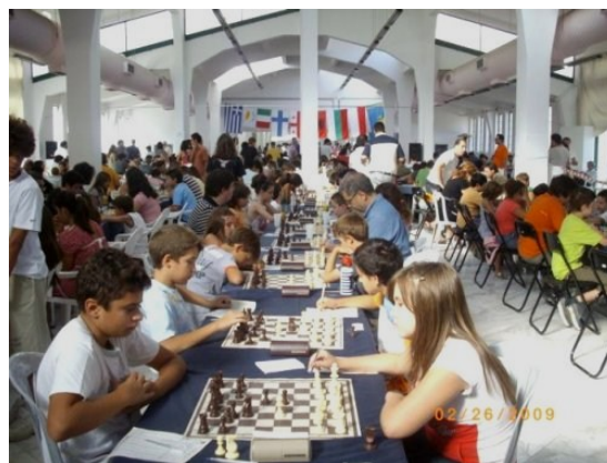
16ο Διεθνές τουρνουά σκάκι το 2008 στη Νίκαια.

Το Δ.Σ. του Συλλόγου μας ευχαριστεί το Δήμο Νίκαιας, τους εργαζόμενους στο Δήμο, καθώς και όλους όσους συνέβαλαν στην επιτυχία της διοργάνωσης.