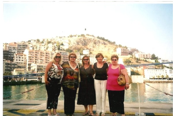
Από την κρουαζιέρα στο Κουσάντασι ,Τουρκία