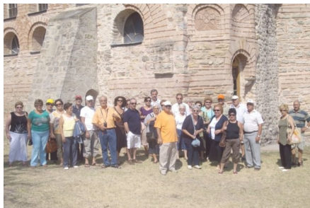
Φέρρες, Βυζαντινός ναός Κοσμοσωτήρας.

Η Ελλάδα μας έχει τόσα πολλά πανέμορφα μέρη και πολλοί από εμάς δεν τα έχουμε επισκεφθεί. Έτσι και εμείς οι εκδρομείς του Φυσιολάτρη αργήσαμε να πάμε στον νομό Έβρου και στις γύρω περιοχές. Είδαμε πολλά και ενδιαφέροντα μέρη και ξεναγηθήκαμε σ' αυτά, ώστε η εβδομαδιαία παραμονή μας να κυλήσει