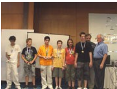
Οι νικητές στα Α 14