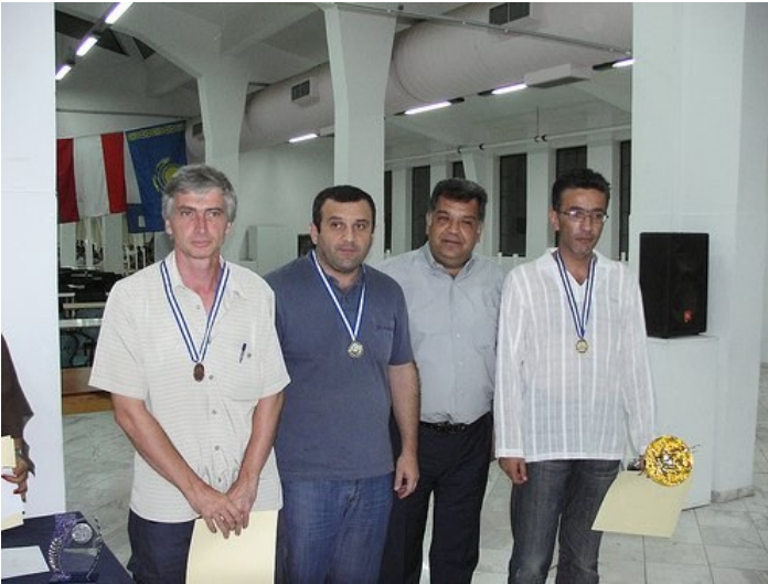
Νικητές στο 16ο Διεθνές τουρνουά σκάκι το 2008 στη Νίκαια.

Στο τουρνουα συμμετείχαν αρκετοί αξιόλογοι GM και