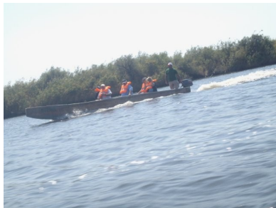
Βαρκάδα στον Έβρο.

Παναγίας Κοσμοσωτήρας και στην συνέχεια μας περίμενε ο Έβρος και τα παρακλάδια του. Ο διάπλους του ποταμού μέχρι τις εκβολές στο Δέλτα του ήταν μια πρωτόγονη εμπειρία και έγινε με τις πλάνες (βάρκες χωρίς καρίνα). Κατά την διάρκεια της βαρκάδας στα κανάλια είδαμε πολλά από τα σπάνια είδη πουλιών που μας είχε αναφέρει η ξεναγός μας και τα οποία διαβιούν σ' αυτό το οικοσύστημα. Την επόμενη μέρα γνωρίσαμε το Διδυμότειχο,