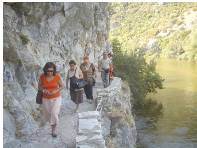
Πορεία στα στενά του Νέστου.

την Ορεστιάδα, τις Καστανιές και τα αξιοθέατα τους. Το μεσημέρι μας βρήκε σ' ένα πανέμορφο καταπράσινο τοπίο στον Αδρά ποταμό όπου γίνονται κάθε χρόνο φεστιβάλ μουσικής με πλήθος κόσμου και συμμετοχή γνωστών καλλιτεχνών. Συνεχίσαμε μέχρι το Πεντάλοφο και βρεθήκαμε σε απόσταση αναπνοής από τα σύνορα με την Βουλγαρία και την Τουρκία. (Τριεθνές).