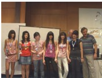
Οι νικητές στα Κ 14.