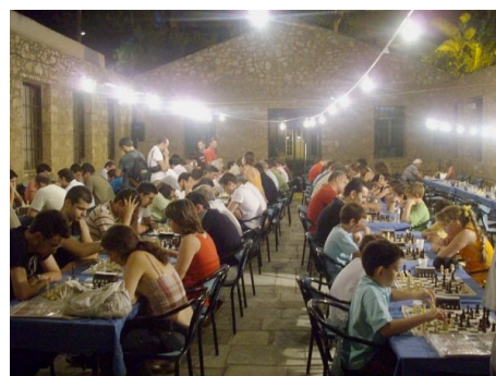
Αγώνες σκάκι στη Μάνδρα της Κοκκινιάς.

έγινε στις 21 Αυγούστου 2008 στο Μουσείο Εθνικής Αντίστασης.