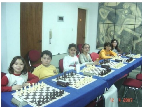
Ομάδα μικρών σκακιστών μας σε αγώνες

Ένα μάθημα υπομονής, σκέψεως, συγκεντρώ-