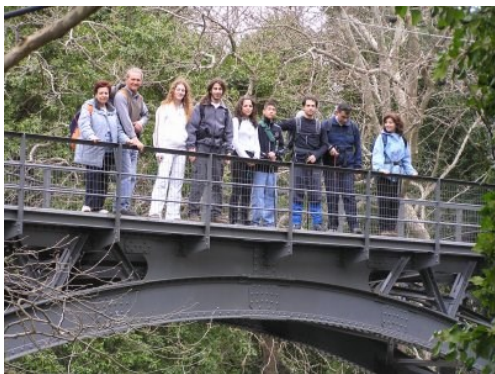
Απρίλιος 2006: Βουραϊκός

Στη διάρκεια του 2006 πραγματοποιούνται εκδρομές