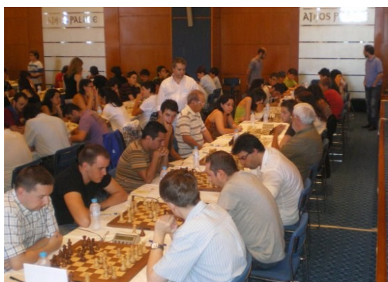
Σ.Ο. Καβάλας-Φυσιολάτρης 6-6

Στους αγώνες συμμετείχαν 31 ομάδες (από τις 34 που είχαν δικαίωμα συμμετοχής). Πρωταθλήτρια αναδείχθηκε για άλλη μια χρονιά η ομάδα του Σ.Ο. Καβάλας με 16β., η οποία δεν άφησε στους αντιπάλους της κανένα περιθώριο αμφισβήτησης της ανωτερότητάς της και μόλις στον όγδοο γύρο έκανε την πρώτη της ισοπαλία με την ομάδα μας, μετά από ένα δραματικό παιχνίδι. Στη δεύτερη θέση κατετάγη η ομάδα της Π.Σ. Περιστερίου με 14β. και τρίτη η Ε.Σ. Θεσσαλονίκης με 14β.