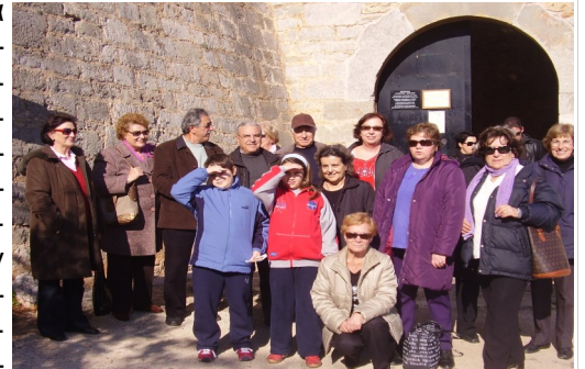
Δεκ. 2007: Παλαμήδι

στην Πάρνηθα (Σπήλαιο Πανός), το καρναβάλι της Κοζάνης και τη Ραψάνη, το Πήλιο, τη Μεσσηνία –Ηλεία, την Ικαρία, το Λουτράκι, την Ορεινή Ναυπακτία, το Μαρα-