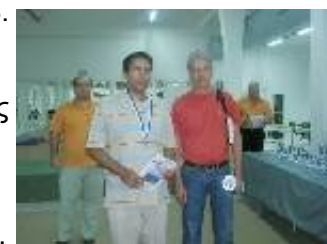
Οι νικητές της γενικής κατάταξης

Στην ομαδική βαθμολογία πρώτη η ομάδα του Φυσιολάτρη.