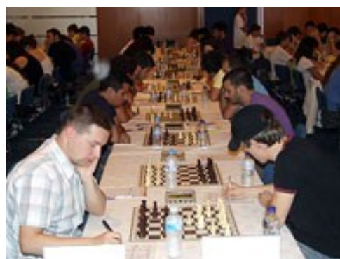
Σ.Ο. Ικαρίας-Φυσιολάτρης 2,5-9,5