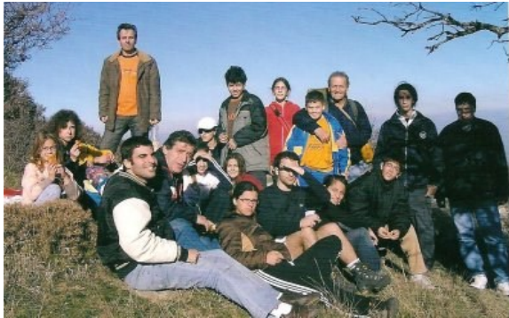
Κλωκός, Νοέμβριος 2005: Η πρώτη εκδρομή του νέου τμήματος.

Η πρώτη εκδρομή του νέου τμήματος πραγματοποιή-