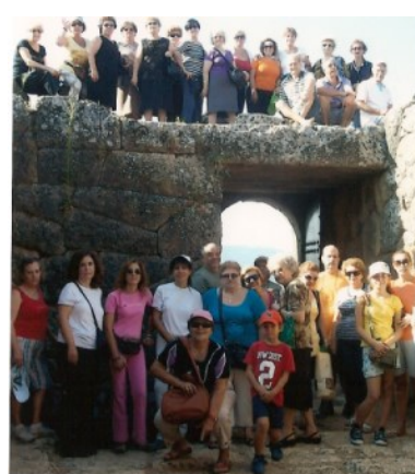
Οι εκδρομείς στο Νεκρομαντείο (Αχέροντας)

Η δεύτερη μέρα της εκδρομής περιελάμβανε επίσκεψη στο Νεκρομαντείο και στη συνέχεια στις πηγές του ΑΧΕΡΟΝΤΑ ποταμού κοντά στο χωριό ΓΛΥΚΗ.