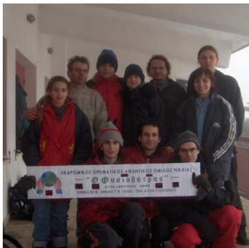
Ιανουάριος 2006: Οι ορειβάτες στον Κιθαιρώνα

θηκε στις 12 Νοεμβρίου 2005 στη Φτέρη Αιγίου, με ανάβαση στον Κλωκό Αχαΐας, και στη συνέχεια στις 10 Δεκεμβρίου στην Πάρνηθα (Φλαμπούρι).