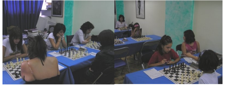
Φυσιολάτρης - Άνω Λιόσια 3-0

Οι αγώνες συνεχίζονται στις 27/9, 11/10 και 18/10.