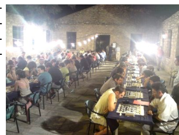
Από το rapid στη Μάντρα της Κοκκινιάς.