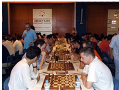
Φυσιολάτρης-Σ.Ο. Καλλιθέας 8-4

Έπαιξαν 17 σκακιστές μας και τα αποτελέσματα ανά σκακιέρα ήταν τα εξής (β./αγ.):