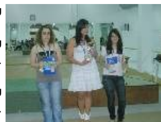
Οι νικήτριες του Πρωταθλήματος Γυναικών Αττικής