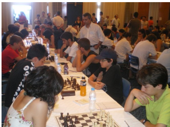
Σ.Ο. Καβάλας-Φυσιολάτρης 6-6

4η σκακιέρα: Γκούμας Γιώργος 5/9 5η σκακιέρα: Θεοτοκάτος Δ. 2,5/5, Χωματίδης Π. 1/2, Καφώρος Α. 0,5/1, Ορنيθόπουλος Ν. 0/1. 6η σκακιέρα (γυναικεία): Φατούρου Ε. 2/8, Αγγελάκη Μ. 0/1. 7η σκακιέρα (νεάνιδα-18): Φράγκου Ε. 3/5, Θέμελη Δ. 1/4. 8η σκακιέρα (κορασίδα-16): Φράγκου Ε. 3,5/4, Θέμελη Δ. 1,5/4, Καφώρου Ηρώ 1/1. 9η σκακιέρα (εφηβική-18): Χωματίδης Π. 4,5/7, Καφώρος Α. 0/1, Φράγκος Β. 1/1. 10η σκακιέρα (προεφηβική-16): Καφώρος Α. 5,5/6, Φράγκος Β. 1,5/2, Μπαρμπαγιάννης Π. 0/1. 11η σκακιέρα (παιδική-14): Μιχελάκος Π. 6/9. 12η σκακιέρα (προπαιδική-12): Παπαδόπουλος Γ. 3/7, Καφώρου Η. 0/1, Παπαδόπουλος Α. 0/1. Ευχόμαστε την επόμενη χρονιά με την κατάλληλη προετοιμασία των σκακιστών μας, αλλά και την εμπειρία που έχουμε αποκτήσει, να βελτιωθούμε και να υπάρξει καλλίτερη πορεία.