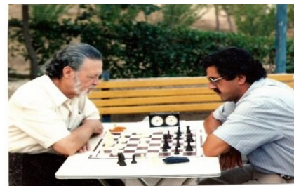
Μια φωτογραφία από τα παλιά Σκάκι στην ύπαιθρο Ι. Παπαδόπουλος –Π. Φύτρος

Στο διάστημα αυτό πραγματοποιήθηκαν και εκδρομές στο εξωτερικό. Το 2007 στη Βουλγαρία και την Τουρκία (Κωνσταντινούπολη), το 2008 στην Κεντρική Ευρώπη (Αυστρία, Ελβετία, Γερμανία, Ιταλία), τους Αγίους Τόπους, και μία κρουαζιέρα στο Αιγαίο (Πάτμο, Ρόδο, Κρήτη και επίσκεψη στο Κουσάντασι).