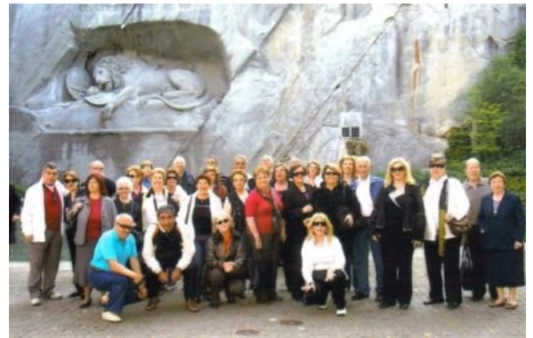
Οκτώβριος 2008: Λιοντάρι σε βράχο