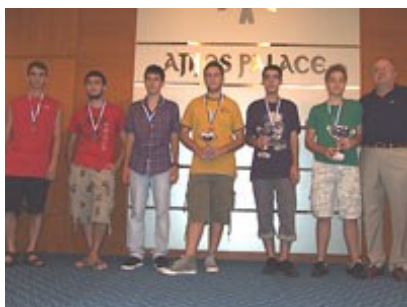
Οι νικητές στην κατηγορία Α-16

Συγχαρητήρια σε όλους τους σκακιστές μας.