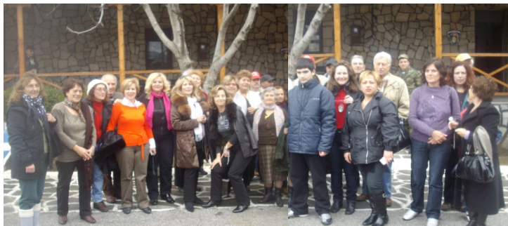
Οι εκδρομείς στο φυλάκιο Κούλας

Η πιο μεγάλη φωτιά άναψε στην πλατεία ηρώων και την είχε οργανώσει ο τοπικός σύλλογος «ΑΡΙΣΤΟΤΕΛΗΣ». Ένα έθιμο με πανάρχαιες ρίζες που αναβιώνει αυτές τις μέρες σε όλες τις πόλεις και τα χωριά της Δυτικής Μακεδονίας.