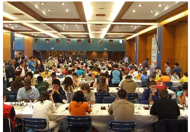
Παγκόσμιο Σχολικό Πρωτάθλημα στη Χαλκίδα

Το πρώτο πράγμα που μαθαίνει το παιδί, που ασχολείται με το σκάκι, είναι να προετοιμάζεται μεθοδικά και να αγωνίζεται για να επιτύχει, στηριζόμενο αποκλειστικά στις δικές του δυνάμεις. Έτσι, σταδιακά μαθαίνει να διακρίνει τη διαφορά ανάμεσα στην ικανοποίηση που αντλεί από το αποτέλεσμα μιας συγκεκριμένης και πειθαρχημένης προετοιμασίας και στο να προσεγγίζει τις προβληματικές καταστάσεις που καλείται να αντιμετωπίσει ευκαιριακά και επιφανειακά.