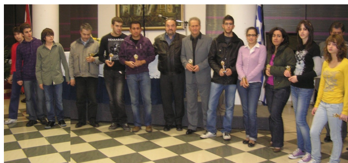
Βράβευση των σκακιστών που αγωνίστηκαν στην Α' Εθνική