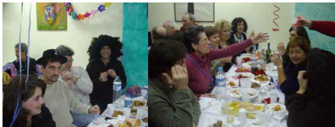
Φαγητό, κρασί και...

Για άλλη μία χρονιά (4η συνεχόμενη), κρατώντας την