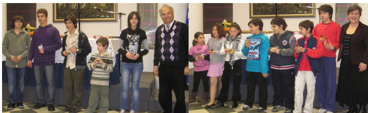
Βράβευση των ομάδων Παιδών και Παμπαίδων

Η εκδήλωση έκλεισε με τις καθιερωμένες βραβεύσεις των αθλητών του σκακιστικού τμήματος που διακρίθηκαν τη