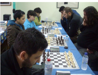
Φυσιολάτρης Β΄ - Σ.Ο. Αιγάλεω Γ΄

Μετείχαμε με 4 οκταμελείς ομάδες, η Α΄ ομάδα στην πρώτη κατηγορία.