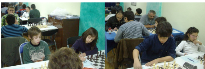
Φυσιολάτρης Γ΄ - Σ.Ο. Αιγάλεω Β΄

Με τη συμμετοχή στους αγώνες αυτούς δόθηκε η δυνατότητα σε όλους τους σκακιστές μας να προετοιμάζονται για τις αγωνιστικές υποχρεώσεις που ακολουθούν.