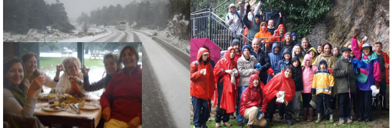
“Έξω χιόνι (Ελικώνας), μέσα η θαλπωρή του τζακιού και το κρασί (Κυριάκι) Οι εκδρομείς στη Μονή Σφυριδας, με βροχή και το ποτό στο χέρι για ζέσταμα

Παρά τις αντίξοες καιρικές συνθήκες, έγιναν, και μάλιστα με πολύ μεγάλη συμμετοχή, οι δύο ημερήσιες εκδρομές μας. Χιόνι, κρύο, βροχή συνόδευσαν τους εκδρομείς οι οποίοι τόλμησαν και το ευχαριστήθηκαν.