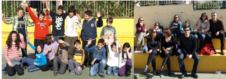
Οι σκακιστές μας σε ένα από τα διαλλείματα και οι γονείς στη...Λιακάδα.

Οι 14 πρώτοι από κάθε τάξη (με αναπλήρωση από τους επόμενους εφόσον κάποιος δεν δηλώσει συμμετοχή) προκρίνονται για το Πανελλήνιο Σχολικό πρωτάθλημα, που θα διεξαχθεί στη Χαλκιδική από 23-25 Απριλίου.