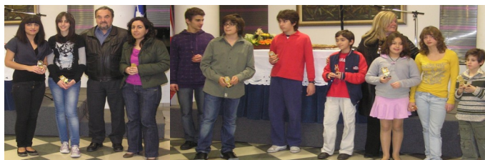
Βράβευση των ομάδων Γυναικών και Παιδών-Κορασίδων (μικτό)

Ακολούθησαν η κοπή της πίτας και οι χαιρετισμοί από τους