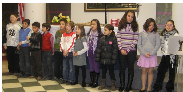
Τα κάλαντα από τους μικρούς σκακιστές μας

Νιώτη και Λαφαζάνη, ο Αντινομάρχης Πειραιά κ. Καρράς, ο δημοτικός σύμβουλος κ. Μπενετάτος Γεράσιμος, ως εκπρόσωπος του Δημάρχου της πόλης μας κ. Μπενετάτου Στέλιου, και ως εκπρόσωπος της Επιτροπής Ειρήνης Κοκκινιάς, οι επικε-