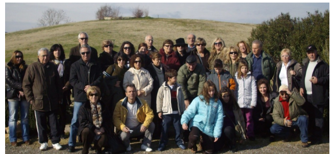
Οι εκδρομείς στη Βεργίνα

Κυριακή πρωί ξεκινήσαμε για το περίφημο Καρναβάλι στο Σοχό. Όταν φθάσαμε εκεί μια ομάδα πεζοπόρων μας έκανε μια ωραία διαδρομή μέχρι το εκκλησάκι του Αγίου Χριστόφορου. Στο χωριό μας υποδέχτηκε ο Δήμαρχος και παρακολούθησαμε τις προετοιμασίες για το έθιμο του γάμου. Από νωρίς οι κουδονοφόροι τράγοι με την παραδοσιακή στολή τους και τα κουδούνια δεμένα στη μέση τους, που ζυγίζουν πάνω από 20 κιλά, τριγύριζαν όλες τις συνοικίες χορεύοντας και πίνοντας ξεσηκώνοντας όλο τον κόσμο για το γάμο. Το ξύρισμα του