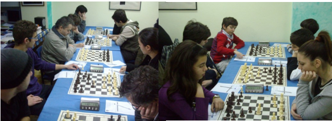
Φυσιολάτρης Α΄ - Π.Σ. Περιστερίου

Ολοκληρώθηκαν οι αγώνες για το Κύπελλο Αττικής Φιλίας «Ν. Στρόφαλης» στο οποίο συμμετείχαν συνολικά 37 ομάδες, σε δύο κατηγορίες.