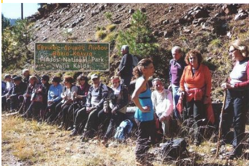
Στα ίχνη της καφέ αρκούδας

Τη δεύτερη μέρα ξεκινήσαμε απ' το γραφικό χωριό Μηλιές για τη Βάλια Κάλντα. Με δυο μικρά πουλμανάκια 35 άτομα ανεβήκαμε στον Εθνικό Δρυμό. Φτάσαμε στο Αρκουδόρεμα και από εκεί κάναμε μια φανταστική κυκλική διαδρομή 4 ωρών στην αρχή δίπλα στο ποτάμι και στη συνέχεια μέσα από τα πανύψηλα πεύκα που νόμιζες ότι άγγιζαν τον ουρανό. Ο καιρός ήταν εξαιρετικός και όλοι μείναμε κατενθουσιασμένοι από το πανέμορφο τοπίο.