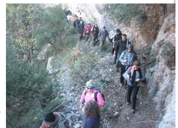
Στο μονοπάτι των Σιδηροδρομικών .

♦ Κυριακή 12 Δεκέμβρη εκδρομή και πορεία στο Μονοπάτι των Σιδηροδρομικών. Στρίβοντας αριστερά στην Εθνική μετά τις Θερμοπύλες φτάσαμε ψηλά στο Δέλφικο και παίρνοντας ένα αγροτικό δρόμο φτάσαμε στο Σιδηροδρομικό σταθμό του Ασωπού. Από εκεί ξεκινάει η μαγευτική διαδρομή παράλληλα στις γραμμές, στο φαράγγι του Ασωπού ποταμού, κοντά στο γνωστό από τα αρχαία «πέραςμα του Εφιάλτη», από όπου ο Εφιάλτης οδήγησε τους Πέρσες στα νότια των Σπαρτιατών στη μάχη των Θερμοπυλών. Ένα μονοπάτι με θέα τις παλαιές πετρόκτιστες γέφυρες και τις στοές της σιδηροδρομικής γραμμής με στενά περάσματα και σπηλιές που καταλήγει στην Ηράκλεια. Ένα φανταστικό μέρος με αρχιτεκτονική και ιστορία που μετά την αλλαγή πορείας του τρένου πρέπει να αναδειχθεί σαν πολιτιστική κληρονομιά των Ελλήνων.