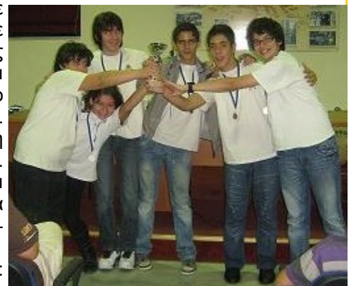
Οι παίδες μας στην απονομή του κυπέλλου