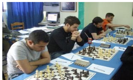
Φυσιολάτρης—Πετρούπολη, Κύπελλο 2010

Οι αγώνες γίνονται με σύστημα νοκ-άουτ. Η ομάδα της Αττικής που θα προκριθεί θα δώσει αγώνες μπαράζ στις 12 και 19/6 για να περάσει στη τελική φάση (final four), που θα γίνει στις 30/6 και 1/7/2011.