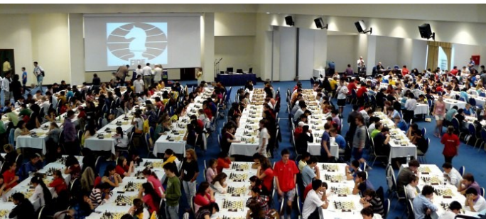
Παγκόσμια Νεανικά Πρωταθλήματα 2010, Χαλκιδική

Τα δύο βασικότερα χαρακτηριστικά του σκακιού, που είναι αλληλένδετα μεταξύ τους, είναι η παντελής έλλειψη τύχης και η δυνατότητα πλήρους πληροφόρησης των δεδομένων. Από θεωρητική