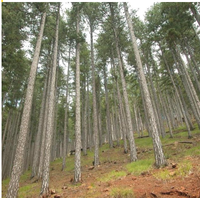
Τα πανύψηλα πεύκα της κοιλάδας

Την πρώτη μέρα γιορτάσαμε την Εθνική μας επέτειο στο πούλμαν, κατά τη διάρκεια της διαδρομής, με μια θαυμάσια παρουσίαση που ετοίμασε ο Κυριάκος Νικολαΐδης και διάβασε αποσπάσματα ο γνωστός ηθοποιός μας Γιώργος Τσιδίμης. Φτάνοντας στην Καλαμπάκα ανεβήκαμε στα Μετέωρα. Εντυπωσιαστήκαμε από το σπάνιο αυτό γεωλογικό φαινόμενο με τους θεόρατους βράχους και πάνω τους σκαρφαλωμένα τα γραφικά μοναστήρια του Μεγάλου Μετεώρου, Αγίου Στεφάνου, Βαρλαάμ και άλλα μικρότερα. Επισκεφτήκαμε τη Μ. Αγίου Στεφάνου και θαυμάσαμε στο μουσείο της, σπάνια χειρόγραφα και ιερά κειμήλια.