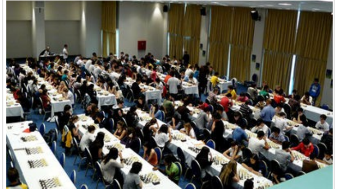
Παγκόσμια Νεανικά Πρωταθλήματα 2010, Χαλκιδική

Η έλλειψη τύχης στο σκάκι εξαναγκάζει το άτομο να αναγνωρίσει ότι το αποτέλεσμα μιας παρτίδας οφείλεται στις δικές του προσπάθειες, σε σύγκριση βέβαια με εκείνες του αντιπάλου. Αυτή η διαδικασία λειτουργεί προς δύο κατευθύνσεις, ανάλογα με