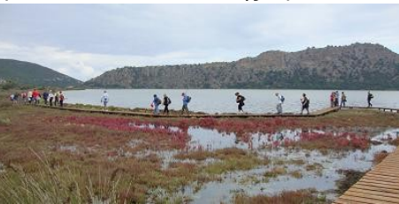
Πορεία στον υγροβιότοπο της Γιάλοβας

Κυριακή πρωί αναχωρήσαμε για τον περιφημο υγροβιότοπο της Γιάλοβας . Με αφορμή την παγκόσμια ημέρα των πτηνών παρακολουθήσαμε από τα παρατηρητήρια με κυάλια τα πουλιά της λιμνοθάλασσας. Έπειτα κάναμε