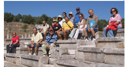
Στο Αρχαίο Θέατρο της Μεσσηνίας.

Τελικά ο Φιλοκτήτης την άναψε και ο Ηρακλής του χάρισε τα όπλα του. Οι τουρίστες διάλεξαν μια μικρότερη αλλά πανέμορφη διαδρομή Αγία Τριάδα-ρεματιά Παύλιανης κοντά στο χωριό.