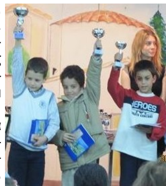
Οι νικητές στα Αγόρια -8