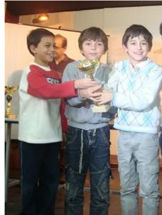
Οι μικροί μας με το κύπελλο

Τη 2η θέση στην τελική κατάταξη κατέλαβε η ομάδα των μικρών σκακιστών μας. Το πρωτάθλημα αυτό διεξήχθη για πρώτη φορά τη φετινή περίοδο.