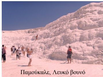
Παμούκαλε, Λευκό βουνό

Συνεχίσαμε προς τα βάθη της Τουρκίας περνώντας από τη Σπάρτη και τη Πισιδία και φτάσαμε στο χωριό Άβανος της Καππαδοκίας. Μια ολόκληρη πόλη σκαλισμένη μέσα στα βράχια. Εξαιρετική εμπειρία για λίγους από εμάς ήταν η πτήση με αερόστατο πάνω από τη κοιλάδα του Γκιόρεμε. Επισκεφτήκαμε τη Καισάρεια , το φαράγγι των Νεραϊδένιων καπνοδόχων, τη κοιλάδα Κιλιτσλάρ και την υπόγεια πολυόροφη