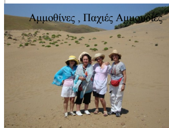
Αμμοθίνες, Παχιές Αμμουδιές