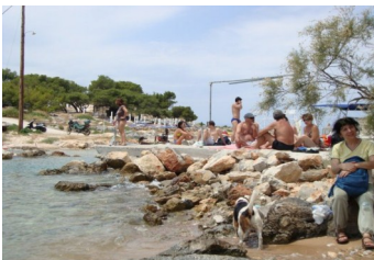
Μπάνιο στην Απόνησο

Ξεκινήσαμε τη πορεία μας μια ομάδα προς τη παραλία της Χαλικιάδας και οι άλλοι προς την Απόνησο. Πέρασαμε μέσα από το Μεγαλοχώρι και ανηφορίσαμε για το όμορφο πευκόδασος, το οποίο διασχίσαμε και περπατώντας για ένα δίκωρο περίπου, καταλήξαμε στην Απόνησο, όπου και κάναμε το μπάνιο μας. Γραφικότατο μέρος, με το ιδιωτικό νησάκι του, τη θέα