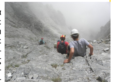
Κατεβαίνοντας στο Λούκι .

Κατεβαίνοντας από το Μύτικα και βλέποντας τη κορυφή δε πιστεύαμε στα μάτια μας ότι είχαμε καταφέρει να πάμε τόσο ψηλά. Παίρνοντας δύναμη από τους Ολύμπιους θεούς συνεχίσαμε για το οροπέδιο των Μουσών. Διασχίσαμε απότομα φαράγγια και φτάσαμε στο καταφύγιο. Εκεί όπου ο ήλιος δεν έφτανε είδαμε κατακαλόκαιρο τεράστια κομμάτια παγωμένου χιονιού .