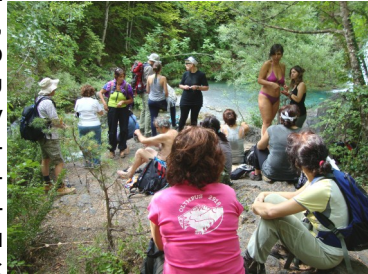
Στα παγωμένα νερά του Ενπιέα.

Τη τελευταία μέρα άρχισε η αντίστροφη πορεία. Πρωί-πρωί φορτώσαμε τα πράγματα στα μουλάρια και κατηφορίσαμε για τα Πριόνια. Στα πόδια μας είχαμε φτερά και σε μια ώρα και κάτι φτάσαμε στα Πριόνια. Εκεί μας περίμενε το πούλμαν με την άλλη ομάδα που έκανε το φαράγγι του Ενπιέα. Κατενθουσιασμένοι και αυτοί από την υπέροχη διαδρομή, όπου έζησαν μια μοναδική εμπειρία. Το μονοπάτι (Ε4) περνούσε μέσα από ατελείωτα