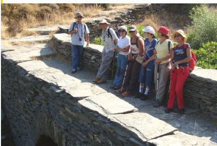
Πεζοπορία στην Άνδρο

Την τρίτη μέρα περπατήσαμε έως τα Διποτάματα, περάσαμε από το