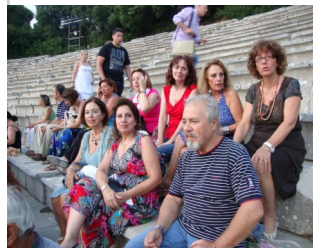
Αρχαίο θέατρο Επιδαύρου

Το πρωί της 6 ης Αυγούστου ξεκινήσαμε από τη Νίκαια για μια εξόρμηση διαφορετική από τις συνηθισμένες! Φθάνοντας στο Ναύπλιο μια ομάδα