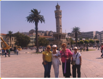
Σμύρνη, Ο πύργος με το ρολόι

Ξεκινήσαμε την εκδρομή μας περνώντας τον Ελλήσποντο προς τα Μικρασιατικά παράλια και ξεναγηθήκαμε στο Αιβαλί , στη Παλαιά Φώκαια και τέλος στη πολυτραγουδισμένη Σμύρνη. Εδώ Θαυμάσαμε το Πύργο με το ρολόι σύμβολο της πόλης, τις παλαιές Ελληνικές συνοικίες με τα ελληνικά αρχοντικά τους και επισκεφτήκαμε τα Βούρλα και το Κορδελιό.