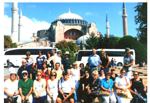
Κωνσταντινούπολη, Αγία Σοφία.

13 ημέρες στα παράλια και στο εσωτερικό της Τουρκίας ήταν αρκετές για να φέρουν πίσω παλαιές μνήμες από τη «χαμένη πατρίδα». Ήταν σα να βρισκόμασταν εκδρομή στην Ελλάδα όλα γνωστά και οικεία, ακόμα και οι ονομασίες των πόλεων με τα κτίριά τους να μας θυμίζουν ότι εκεί κάποτε άνθισε ο Ελληνικός πολιτισμός. (συνέχεια στη σελ. 5)