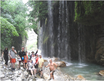
Ο καταρράκτης στο Πάντα-

Την άλλη μέρα πρωί πρωί επιβιβαστήκαμε σε αγροτικά αυτοκίνητα και ξεκινήσαμε για το Πάντα-Βρέχει. Η διαδρομή ήταν δύσκολη, 2 ώρες χωματόδρομος αλλά μέσα σε φανταστικό τοπίο. Όταν φτάσαμε στο φαράγγι ξεκινήσαμε για τον καταρράκτη. Η απόσταση που είχαμε να διασχίσουμε ήταν μόνο 800 μέτρα μέσα στο ποτάμι, αλλά