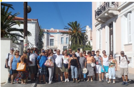
Βόλτες στη Χώρα της Άνδρου.

Το Σεπτέμβριο πραγματοποιήθηκε εκδρομή στο μαγευτικό κυκλαδίτικο νησί της Άνδρου. Με πλοίο από Ραφήνα φτάσαμε στο Γαύριο και από εκεί με πούλμαν πήγαμε στη Χώρα. Εδώ επισκεφθήκαμε το αρχαιολογικό μουσείο, το Μουσείο Σύγχρονης Τέχνης και περιπλανηθήκαμε στα στενάκια της Χώρας. Το απογευματάκι φθάσαμε στο ξενοδοχείο μας, στα Αποίκια, δίπλα στην Πηγή Σάριζα.