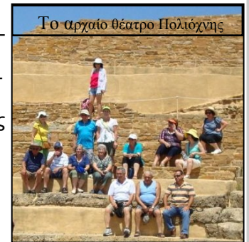
Το αρχαίο θέατρο Πολιόχνης