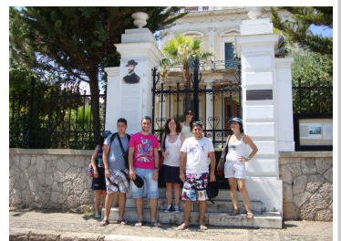
Αρχοντικό στις Σπέτσες

Μετά το πρωινό μας κατηφορίσαμε προς την Κόστα. Πήραμε το караβάκι για τις Σπέτσες, επισκεφθήκαμε τα αξιοθέατα κάνοντας βόλτες στα στενάκια της πόλης και κολυμπήσαμε σε κάποια από τις παραλίες του νησιού. Ύστερα πήραμε το δρόμο της επιστροφής, κλείνοντας έτσι το ξεχωριστό αυτό «εκπαιδευτικό» διήμερο.