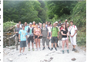
Πριόνια. Ξεκίνημα της ανάβασης

Το ταξίδι μας προς τον ξακουσμένο στα πέρατα του κόσμου Όλυμπο, το βουνό των δώδεκα Θεών της αρχαιότητας, ξεκίνησε με ευχάριστη διάθεση και κυρίως μεγάλη περιέργεια να κατανοήσουμε τον λόγο για τον οποίο οι αρχαίοι Έλληνες επέλεξαν το συγκεκριμένο τόπο για να χτίσουν το μυθικό παλάτι των δώδεκα Θεών τους. Όλες μας οι απορίες λύθηκαν τη στιγμή που κατεβήκαμε από το πούλμαν, φτάνοντας στα Πριόνια και αντικρίζοντας το μαγευτικό τοπίο ολόγυρά μας. Στη διαδρομή κάθε τόσο συναντούσαμε ανθρώπους από όλες τις χώρες του κόσμου. Ένας χαιρετισμός , ένα «μπράβο, κουράγιο και σε λίγο φτάνετε» καθώς και μια σύντομη κουβενοτούλα διέκοπταν για λίγο τη πορεία μας. Μετά από τρεις ώρες κουραστικής πεζοπορίας φτάσαμε στο καταφύγιο «Ζολώτας» αργά το απόγευμα. Ξεκουραστήκαμε , φάγαμε και ξαφνικά το βράδυ ενώ χαζεύαμε τη θέα προς το Λιτόχωρο όλα τα φώτα του καταφυγίου έσβησαν και ο χώρος φωτίστηκε από εκατομμύρια αστέρια που τρεμόπαιζαν στον ουρανό.