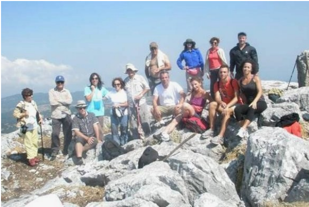
Στη κορυφή του Ξηρού όρους

Σάββατο, 24 Σεπτέμβρη, ξεκινήσαμε για ένα όμορφο διήμερο στην Βόρεια Εύβοια. Τη πρώτη μέρα περπατήσαμε περίπου 4 ώρες μέσα στο πανέμορφο πευκόδασος του όρους Λιχάς. Φτάνοντας στην παραλία Αγαπητός, κάναμε το μπάνιο μας, χαλαρώσαμε και, αφού φάγαμε ότι πρόχειρο είχαμε μαζί μας, ξεκινήσαμε για το ξενοδοχείο. Όσοι δεν περπάτησαν κατευθύνθηκαν προς τον Αγ. Γεώργιο και πήγαν με βάρκα για μπάνιο στα όμορφα Λιχαδονήσια.