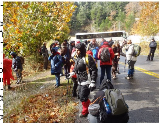
Πεζοπορία στη Δίρφη

Οι πιο έμπειροι και τολμηροί συνέχισαν μετά τη Ράχη Συκά, με σκοπό να ανέβουν την κορυφή της