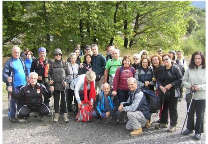
Στο πανέμορφο όρος Μαίναλο

Δύο επισκέψεις στο όρος Μαίναλο, με τα περίφημα ελατοδάση, στην καρδιά της Αρκαδίας πραγματοποιήσαμε το Φθινόπωρο.