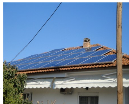
Φωτοβολταϊκό στη στέγη σπιτιού.

Φωτοβολταϊκές Μονάδες που έχουν σαν στόχο τη παραγωγή ηλεκτρικής ενέργειας και η πώληση της σε κάποιον προμηθευτή (καταναλωτή) είναι τα φωτοβολταϊκά πάρκα . Η ισχύς σε αυτές τις περιπτώσεις μπορεί να είναι από μερικά KW έως και αρκετά MW. Στην Ελλάδα η συνηθέστερη επένδυση σε αυτά τα επίπεδα είναι αυτή των 100KW . Τελευταία πολλοί επενδυτές αλλά και ιδιώτες έχουν στραφεί και σε μικρότερους φωτοβολταϊκούς σταθμούς 10- 20KW , όπου η διαδικασία αδειοδότησης είναι πολύ απλή και μπορεί μάλιστα να ολοκληρωθεί άμεσα και γρήγορα. Τέτοιες μονάδες παρατηρούμε σήμερα εγκατεστημένες στις στέγες σπιτιών, εργοστασίων και στους αγρούς. Η απόσβεση μπορεί να γίνει σε 6-7 χρόνια και στη συνέχεια έχουμε ένα καθαρό εισόδημα 6-15 χιλιάδες Ευρώ ετησίως για εγκατάσταση 10-20KW.