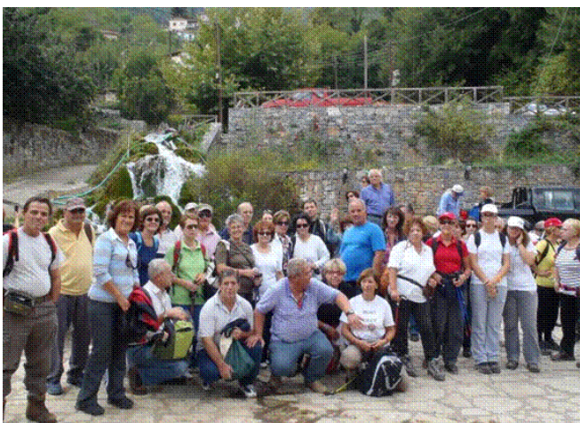
Στο μικρό καταρράκτη του Πλατάνου.

Ημερήσια εκδρομή πραγματοποιήσαμε στο Άστρος Κυνουρίας. Φθάνοντας στο παράλιο Άστρος, στη λιμνοθάλασσα του Μουστού παρατηρήσαμε με τηλεσκόπια τα μεταναστευτικά πουλιά. Στη συνέχεια πήγαμε στο χωριό Πλάτανος και μπροστά από το μικρό καταρράκτη τραβήχτηκε η αναμνηστική φωτογραφία.