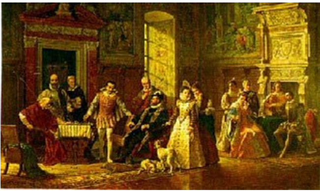
Σκακιστική ζωή στην αυλή του βασιλιά της Ισπανίας Πίνακας του Luigi Mussini, 1886

Η Ισπανία κρατάει τα πρωτεία της διοργάνωσης του πρώτου σκακιστικού τουρνουά στην ιστορία, τουλάχιστον με βάση τα αρχεία που έχουν φτάσει στα χέρια μας. Εκεί στην Αυλή του βασιλιά Φιλίππου του Β', το 1575, συναντήθηκαν οι τέσσερις κατά τεκμήριο ισχυρότεροι παίχτες της εποχής: οι Ιταλοί Λεονάρντο ντα Κούτρι και Πάολο Μπόι με τους Ισπανούς Ρούι Λόπεθ και Αλφόνσο Θερόν. Μέχρι τότε οι Ισπανοί είχαν τα αδιαμφισβήτητα πρωτεία στο ευρωπαϊκό σκάκι. Οι Ιταλοί παίχτες όμως νίκησαν κι από τότε άρχισε μια ιταλική κυριαρχία που κράτησε περισσότερο από 150 χρόνια.