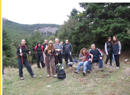
Ανοπαία ατραπός (Μονοπάτι του Εφιάλητη)

• Με ωραίο καιρό έγινε και η πεζοπορία μας στο γνωστό μονοπάτι του εφιάλητη στο όρος Καλλίδρομο στις 18