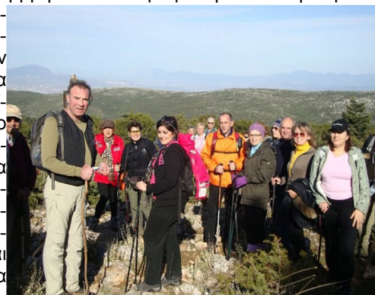
Πεζοπορία στη Πάρνηθα

Στη διαδρομή συναντήσαμε και μερικά από τα γνωστά κόκκινα ελάφια του