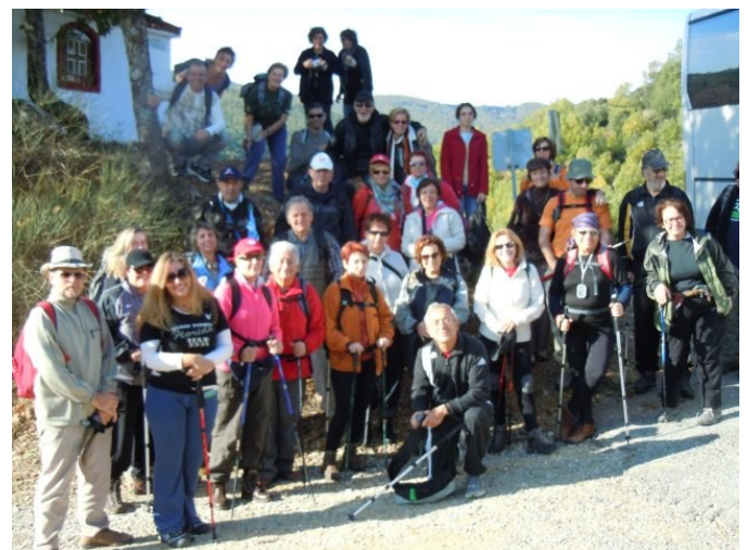
Ξεκίνημα πορείας στο Χολομώντα

Ένα όμορφο τετραήμερο περάσαμε με πεζοπορίες στην πευκόφυτη Χαλκιδική, κάναμε τον περίπλου του Αγίου Όρους, επισκεφτήκαμε την όμορφη Ουρανούπολη και τη γραφική Καβάλα και ξεναγηθήκαμε στο σπήλαιο των Πετραλώνων και στο περίφημο Δίον Πιερίας. Διανυκτερεύσαμε στο πανέμορφο παραλιακό ξενοδοχείο ATHENA PALACE *****, στην Ελιά Χαλκιδικής.