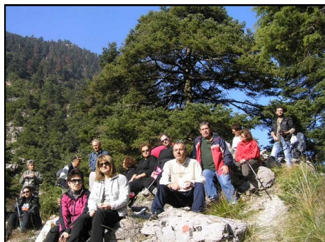
Πεζοπορία στα Διπόταμα

• Με λιακάδα έγινε η εκδρομή μας στις 20 Νοεμβρίου