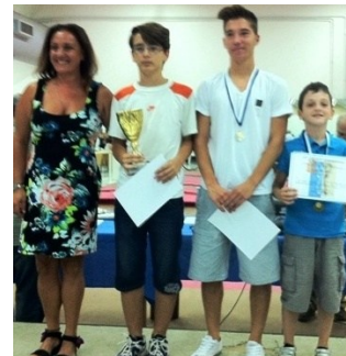
Οι νικητές του β΄ Ομίλου

Ευχαριστούμε τη Δημοτική αρχή καθώς και όλους όσοι συνέβαλαν στην επιτυχία της διοργάνωσης.