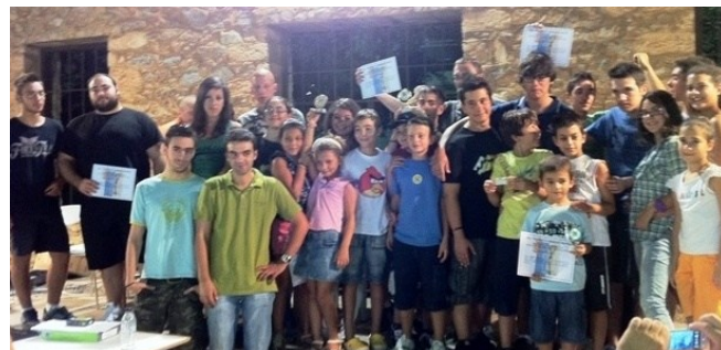
Οι νικήτριες ομάδες του Rapid

Στα πλαίσια των εκδηλώσεων του Δήμου Νίκαιας – Αγ. Ι. Ρέντη για τη 68 η επέτειο από το ΜΠΛΟΚΟ ΤΗΣ ΚΟΚΚΙ-