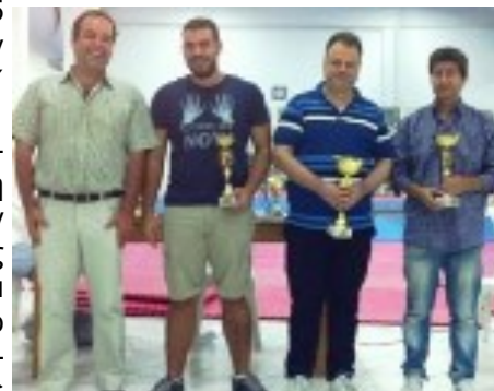
Οι 3 πρώτοι νικητές του α΄ ομίλου

Το τουρνουά είναι αφιερωμένο στην Εθνική Αντίσταση κατά των δυνάμεων κατοχής 1940-44 και διοργανώθηκε από το Δήμο Νίκαιας-Αγ.Ι.Ρέντη σε συνεργασία με τον