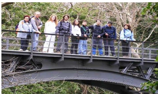
Απρίλιος 2006: Βουραϊκός

Στη διάρκεια του 2006 πραγματοποιούνται εκδρομές στο