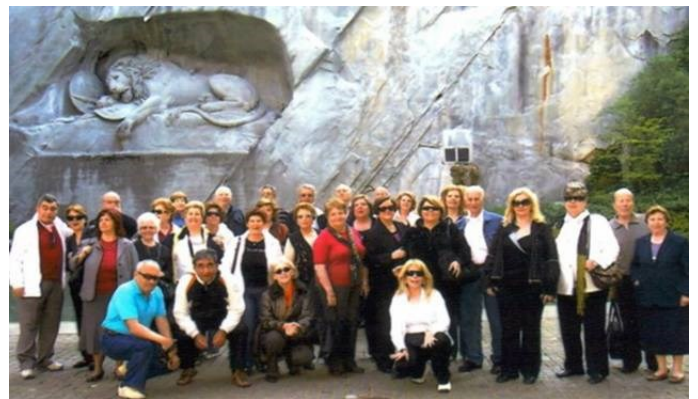
Οκτώβριος 2008: Λιοντάρι σε βράχο

Στη διάρκεια του 2008 πραγματοποιούνται εκδρομές στο Μαυρονόρος-Ευρωστίνα, την Παύλιανη, στο καρναβάλι της Κρύας Βρύσης και τον Τύρναβο, το Καρπενήσι, τη Σαλαμίνα, τον Όσιο Λουκά-Κυριάκι Βοιωτίας, τη Ζαχλωρού-Σπήλαιο Λιμνών, τη Χαλκιδική, τα Ζαγοροχώρια, τη