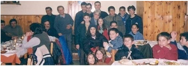
Οινόη, 2003: Η πρώτη εξόρμηση και συνεστιάση των μελών και των φίλων του Ομίλου

Νωρίτερα, και αμέσως μετά την ίδρυση του ομίλου, υπήρχε υποτονική δραστηριοποίηση με τη διενέργεια κυρί-