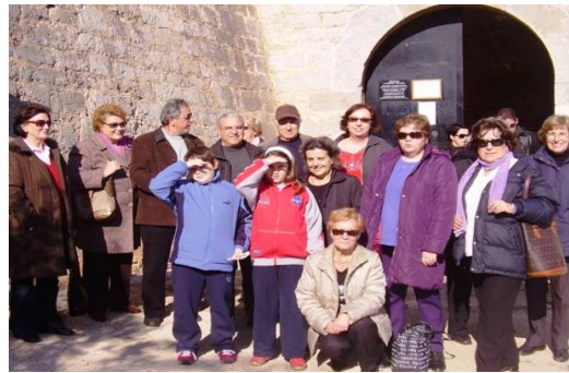
Δεκ. 2007: Παλαμήδι

Στη διάρκεια του 2007 πραγματοποιούνται εκδρομές