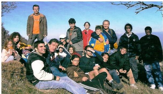
Κλωκός, Νοέμβριος 2005: Η πρώτη εκδρομή του νέου τμήματος.

Η πρώτη εκδρομή του νέου τμήματος πραγματοποιήθηκε