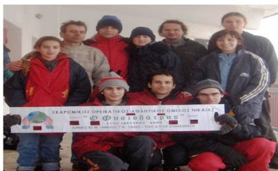
Ιανουάριος 2006: Οι ορειβάτες στον Κιθαιρώνα

Από τις αρχές του 2006, το τμήμα αρχίζει να δραστηριοποιείται με δειλά στην