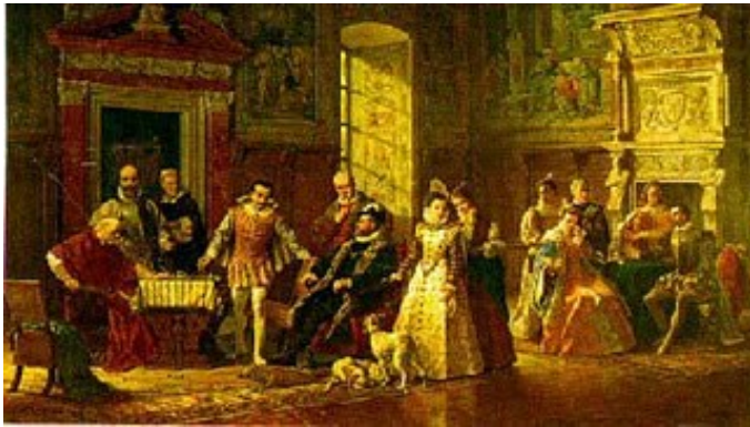
Σκακιστική ζωή στην αυλή του βασιλιά της Ισπανίας Πίνακας του Luigi Mussini, 1886

Δεν είναι τυχαίο που το σκάκι είναι γνωστό ως το παιχνίδι των βασιλιάδων. Το σκάκι πάντα προσέλκυε τα μεγάλα μυαλά και κυρίως τους βασιλιάδες. Ίσως γιατί βασιλιάδες και αυτοκράτορες που έλεγχαν μεγάλες αυτοκρατορίες και στρατούς είδαν μέσα στο σκάκι τη δυνατότητα να ασκούν το μυαλό τους στη στρατηγική, στο