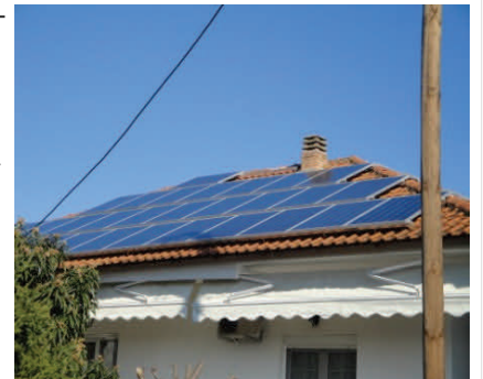
Φωτοβολταϊκό στη στέγη σπιτιού.

μικρότερους φωτοβολταϊκούς σταθμούς 10-20KW , όπου η διαδικασία αδειοδότησης είναι πολύ απλή και μπορεί μάλιστα να ολοκληρωθεί άμεσα και γρήγορα. Τέτοιες μονάδες παρατηρούμε σήμερα εγκατεστημένες στις στέγες σπιτιών, εργοστασίων και στους αγρούς. Η απόσβεση μπορεί να γίνει σε 6-7 χρόνια και στη συνέχεια έχουμε ένα καθαρό εισόδημα 6-15 χιλιάδες Ευρώ ετησίως για εγκατάσταση 10-20KW.